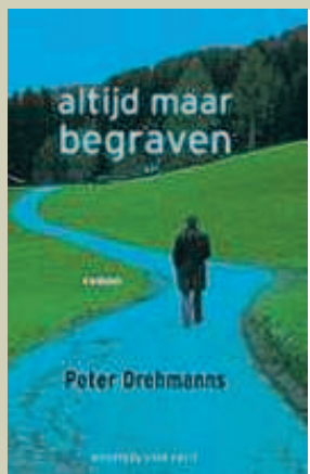
PETER DREHMANNS Altijd maar begraven Contact, Amsterdam 285 p., 21,90 euro

Terwijl de hoofdpersoon op zijn tocht gaandeweg van geen hout pijlen meer weet te maken, laat de auteur zijn zinnen sprankelen en vonken